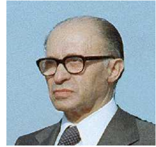
Abb. 12: Begin

Der erste Libanonkrieg dauerte von Juni bis September 1982. Ursache waren die Übergriffe der im Südlibanon stationierten PLO von Yassir Arafat auf israelische Zivilisten. Das erklärte Kriegsziel des Generals Ariel Scharon bestand in der Ausrottung der PLO. Der Libanon begrüßte die einmarschierenden Israelis mit Blumen als Befreier von der schrecklichen Pest der PLO. Der Krieg führte zur Einkesselung der PLO in Beirut. Kurz vor ihrer Vernichtung kam es dann jedoch nach amerikanischer und russischer Intervention zur Befreiung Yassir Arafats und seiner Resttruppe. Er konnte ins Exil