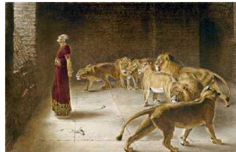
Abb. 6: Daniel

Daniel 7, Verse 23-25: „...Das vierte Tier bedeutet ein viertes Reich, das auf Erden sein wird; das wird sich von allen anderen Königreichen unterscheiden, und es wird die ganze Erde fressen, zerstampfen und zermalmen. Und die zehn Hörner bedeuten, dass aus jenem Reich zehn Könige aufstehen werden; und ein anderer wird nach ihnen aufkommen, der wird verschieden sein von seinen Vorgängern und wird drei Könige erniedrigen. Und er wird freche Reden gegen den Allerhöchsten führen, und er wird danach trachten, Zeiten und Gesetz zu ändern, und sie werden in seine Gewalt gegeben für eine Zeit, zwei Zeiten und eine halbe Zeit.“