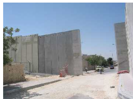
Abb. 15: Betonmauer