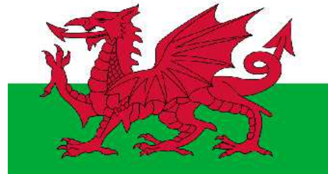
Abb. 4: Drache

Der Drache ist Gottes erklärter Feind und somit auch in der Geschichte der Welt der Feind Israels. Das hat sich immer wieder dadurch gezeigt, dass die satanischsten Diktaturen der Erde sich dadurch zu erkennen gaben, dass sie in besonderer Art die Juden verfolgt und getötet haben. Dieses Phänomen reicht bis in das 20. Jahrhundert hinein, und es wurde zuletzt in dem schrecklichen Holocaust Adolfs Hitlers sichtbar. Die Reaktion Gottes auf solche Verfolgungen wurde allerdings auch offenbar: Deutschland wurde im zweiten Weltkrieg bis auf die Grundmauern zerstört. Nur drei Jahre später entstand der neuzeitliche Staat Israel. So ist es immer, und so wird es immer sein, denn Gott sagte zu Abraham: „Wer dich segnet, den werde ich segnen, und wer dir flucht, den werde ich verfluchen“