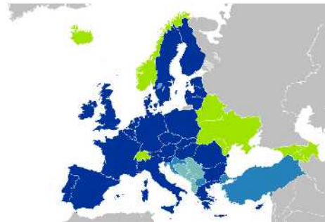
Abb. 20: Staaten der EU

Der Antichrist wird Israel politisch mit Europa solidarisieren, weil er ja auch selbst aus Europa stammen wird. Er wird den Tempel in Jerusalem bauen, nach dem sich die orthodoxen Juden, aber auch die internationalen Freimaurerlogen seit Jahrhunderten gesehnt haben. Die orthodoxen Juden werden ihm zu Füßen liegen, wenn der mosaische Opferdienst im dritten Tempel Jerusalems wieder beginnen wird. Er wird das Land Israel zur Zeit seines falschen Friedensreiches in der biblisch verheißenen Ausdehnung an die Israelis verteilen.