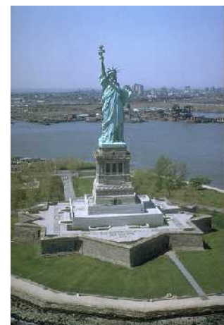
Abb. 18: Lady Liberty

Mancher Kenner der Weltpolitik wird jetzt fragen: Und was ist mit den USA? Amerika ist doch der übermächtige Verbündete Israels, der es niemals zulassen wird, dass irgendjemand dieses Land angreift. Dazu muss gesagt werden, dass in unserer Zeit die geostrategische Macht der USA rapide im Schwinden begriffen ist. Ich bin zudem