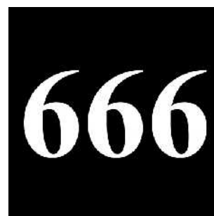
Abb. 19: Zahl des Tieres

In den 90er Jahren des letzten Jahrhunderts hat Papst Johannes Paul II (Karol Woityla aus Polen) bereits von der Hand einer indischen Shivapriesterin ein Malzeichen an seiner Stirn angenommen, das ihm im Rahmen einer religiösen Hinduzeremonie verliehen wurde! Die christliche Gruppe FCC (Former Catholics for Christ) hat das Foto im Internet veröffentlicht. Am Aschermittwoch geschieht mit den einfachen Gläubigen im heutigen Katholizismus schon seit langer Zeit das Gleiche: sie erhalten ein Aschenkreuz an der Stirn oder an der rechten Hand. Dies ist eine klare Konditionierung des Kirchenvolkes hin auf das Kommen des Malzeichens des Tieres.