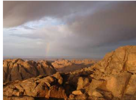
Abb. 3: Berg Sinai

Im Mosaischen Bund vom Berg Sinai finden wir schließlich neben den bedingungslosen Bündnissen noch einen Bundesschluss mit Bedingung zwischen Gott und seinem Volk Israel. Der Mosesbund vom Sinai ist ein Einschub. Er wurde um 1445 v.Chr. in der Wüste geschlossen und gab dem Volk Israel nach dem Auszug aus Ägypten das mosaische Gesetz. Die Haushaltung des Gesetzes endete geschichtlich mit dem Tod des Messias Jesus Christus am Kreuz von Golgatha (Römer 10, 4) und wurde ersetzt durch die Haushaltung der Gnade, in der wir heute noch leben, und die mit der Entrückung der Gemeinde Jesu Christi (das ist die Aufnahme aller Menschen, die an Jesus Christus als ihren persönlichen Erlöser und Herrn geglaubt haben, in den Himmel) enden wird.