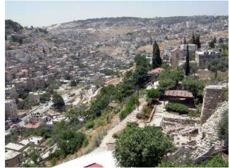
Abb. 24: Kidrontal

Viele Menschen aus allen Nationen der Erde werden sich in der schrecklichen Zeit des antichristlichen Weltreiches richtig entscheiden. Sie werden das Zeichen des Tieres und die Verfolgung der Juden ablehnen. Sie werden den Antichristen nicht verehren und stattdessen auf den Messias Jesus Christus warten. Dieser Entschluss wird die meisten von ihnen das Leben kosten, denn der Antichrist wird versuchen, alle diese Menschen weltweit hinzurichten. Die hingerichteten Menschen werden jedoch das ewige Leben gewinnen, weil sie das zeitliche