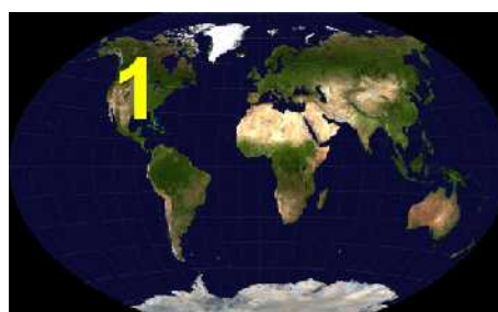
Abb. 21: Nummer 1

Diese dritte Vernichtung wird sich meines Erachtens zeitlich gesehen zwischen den beiden anderen Vernichtungen ereignen. Sie wird sehr kurze Zeit (vielleicht nur wenige Tage) nach dem öffentlichen Auftritt des Antichristen an einem einzigen Tag erfolgen, also innerhalb von 24 Stunden. Die Bibel schreibt sogar in Offenbarung 18, dass Babylon die Große, mit der alle Nationen der Erde Hurerei getrieben haben (das ist Amerika, siehe www.wasistlosindieserwelt.de und: Babylon die Große und der Tod des Phönix) in einer Stunde fallen wird, also innerhalb von 60 Minuten. Diese Zerstörung ist möglich durch die unvorstellbar mächtigen skalaren Waffensysteme Russlands (siehe den Abschnitt über die Waffensysteme der letzten Tage), und Russland wird auch die Weltmacht sein, die diese Zerstörung über Amerika bringen wird. Danach wird Russland wie gesagt selbst zerstört werden, weil es den Mut haben wird, mit denselben Waffen auch Großisrael anzugreifen. Gott hat aber noch bessere Waffen, denn er ist allmächtig. Das haben wir wie gesagt zuvor schon besprochen.