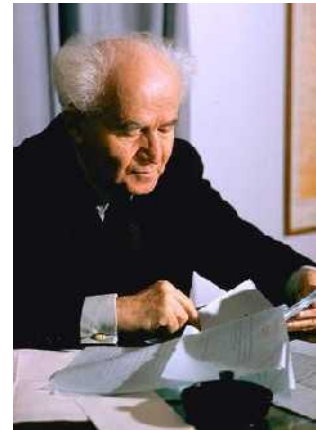
Abb. 10: Ben Gurion

Die unmittelbare Folge der Judenvernichtung der Nazis war dann die Gründung des Staates Israel am 14. Mai 1948. Der UNO-Beschluss wurde Ende 1947 gegen den erbitterten Widerstand der arabischen Welt gefasst. Letztlich geschah es genau so wie es Hesekiel der Prophet gesagt hatte: Aus den Gräbern der Konzentrationslager wurden die Juden herausgeführt, um unmittelbar danach in das alte Land Israel zurückkehren zu können. Der tiefste Punkt in der jüdischen Geschichte war zugleich der entscheidende Wendepunkt.