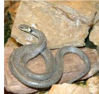
Abb. 5: Schlange

Dem Satan ist schon seit dem Sündenfall bekannt, dass der Same der Frau Israel, der Messias Jesus Christus, ihn letztendlich in den Feuersee werfen wird. Das erste Kommen des Messias aus dem Volk Israel heraus konnte er nicht verhindern. Das Werk von Golgatha und die Auferstehung konnte er nicht verhindern. Die Errettung der Gemeinde durch das Übergreifen des Evangeliums auf alle Nationen konnte er nicht verhindern.