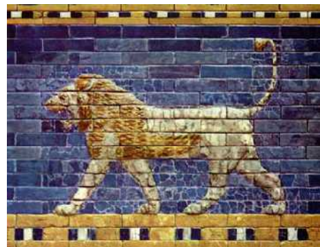
Abb. 8: Mosaik in Babylon

Der zweite Kopf war das assyrische Weltreich. Die Assyrer kamen im achten Jahrhundert v.Chr. an die Macht. Sie eroberten im Jahr 722 v.Chr. das Nordreich Israels und deportierten die Bevölkerung des Landes. Sie siedelten ein Mischvolk in Nordisrael an, dem sie Priester der Götzentempel von Dan und Bethel zuteilten. Dieses Mischvolk sind die Samariter, deren Nachkommen in geringer Zahl bis heute in Israel leben. Sie haben ihr Heiligtum auf dem biblischen Berg Garizim bei Sichem, dem heutigen Nablus. Die Assyrer kamen schließlich bis nach Jerusalem und wollten es ebenfalls einnehmen. Zu dieser Zeit herrschte der König Hiskia über das Südreich. Ihm zur Seite stand der Prophet Jesaja, dessen Dienst die Zeit von etwa 740-686 v.Chr. überspannte. Die Assyrer wurden vor den Toren Jerusalems von der Hand Gottes selbst vernichtet. In einer einzigen Nacht starben 185.000 Mann, und sie mussten abziehen. Gott schützte Jerusalem. Wer Dir flucht, den werde ich verfluchen.