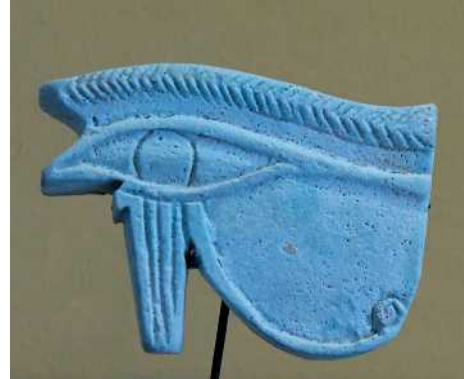
Abb. 7: Horusauge

Abraham war der Vater von Isaak, Isaak der Vater von Jakob, und Jakobs Söhne waren die Stammväter der zwölf Stämme Israels. Jakob zog in seinem Alter mit 70 Leuten nach Ägypten, wo er von seinem Sohn Josef, dem Staatsverwalter des damaligen Pharaos, empfangen und beherbergt wurde. Insgesamt lebten die Israeliten für etwa 400 Jahre in Ägypten. Man könnte diese Zeit auch als die Diaspora des Altertums bezeichnen. Sie vermehrten sich während dieser Zeit zu einem Volk von schätzungsweise 3 Millionen Menschen. Zum Schluss