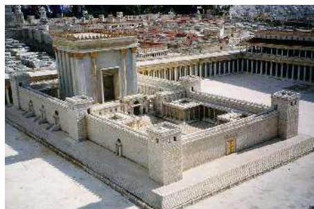
Abb. 22: Modell des Tempels

Der Tag dieses Friedensschlusses wird meines Erachtens der Tag der Eröffnung des dritten Tempels in Jerusalem sein. Dieser Tag wird aus der Sicht der orthodoxen Juden mit Sicherheit der größte Festtag in der Geschichte Israels seit der Eröffnung des Tempels Salomos im Jahr 967 v.Chr. sein. Heute findet man in Kreisen wiedergeborener Christen einige Gruppen, die in nur schwer verständlicher Weise den Judaismus und den kommenden dritten Tempel verehren. Man könnte