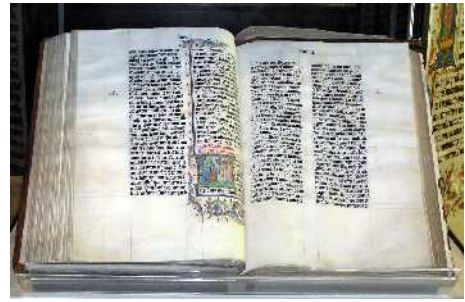
Abb. 25: Die Bibel

Der verantwortliche Mensch in seinem natürlichen Zustand ist aus der Sicht Gottes vom ewigen Leben abgetrennt. Er hat das natürliche Leben und ist darin vielleicht sehr aktiv und erfolgreich. Aber es macht nichts aus ob jemand reich oder arm ist, intelligent oder nicht, moralisch hoch stehend oder nicht, fleißig oder nicht, oder sonst irgendetwas. Kein Mensch erreicht die Herrlichkeit Gottes. Das bedeutet, dass niemand aus eigener Kraft dazu in der Lage ist, sich die Gunst Gottes irgendwie zu erarbeiten. Alle Religionen dieser Welt haben das immer wieder versucht: Gott durch religiöse Aktivitäten oder moralische Anstrengungen zu beeindrucken und gnädig zu stimmen.