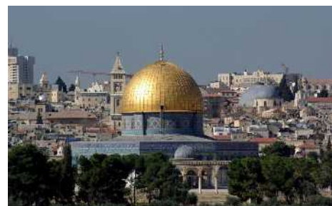
Abb. 1: Felsendom

Er handelt so, weil er die Erfüllung seiner eigenen Zusagen niemals gefährden wird. Es geht um die Glaubwürdigkeit Gottes und der Bundeszusagen seines