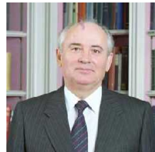
Abb. 17: Gorbatschow

Hier schlägt es einem erneut die Sprache, wenn man die Tagesaktualität betrachtet. Iran ist heute neben den Arabern der grimmigste Feind Israels. Sein stärkster Verbündeter ist Russland. Russland selbst, und nicht mehr die USA, ist in unserer Zeit neben