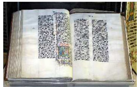
Abb. 23: Die Bibel

Er wird direkt aus dem Himmel über Paran (Nordostsinai) und Teman nach Edom kommen (Habakuk 3,3-15) und die Juden von Bozra/Petra (die Hütten Judas nach Sacharja 12,7) zuerst erretten. Er wird vor den befreiten Juden aus Bozra/Petra herausziehen als der große Durchbrecher der feindlichen Linien (Micha 2,12-13). Dann wird er das gesamte Land Edom auf ewig vernichten. Das wird für die dort noch lebenden Palästinenser den endgültigen Untergang bedeuten. In seinem weiteren Kampf wird er nach Israel hinaufziehen und auf dem Weg zahlreiche weitere Feinde töten. Unterwegs wird er aus einem Bach trinken (Psalm 110,5-7). Schließlich wird er mit blutigen Kleidern auf den Bergen Israels ankommen (Jes.63,1-7). Im Tal Josaphat am Südende der Stadt Jerusalem wird er den Rest der antichristlichen Armeen vernichten und zuletzt als der große Sieger den Ölberg in Jerusalem besteigen. Der Ölberg wird sich spalten