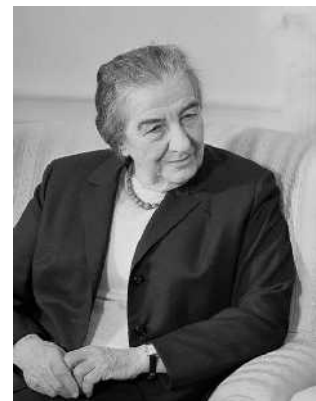
Abb. 11: Golda Meir

Der Yom Kippur Krieg dauerte vom 6. bis 23. Oktober 1973. Die Araber wollten die im Sechstagekrieg verlorenen Gebiete zurückgewinnen. Am höchsten jüdischen Feiertag starteten Ägypten unter Nassers Nachfolger Sadat und Syrien unter Hafez al Assad einen Überraschungsangriff. Sie wurden unterstützt von Truppen aus Irak, Saudi Arabien, Pakistan, Kuwait, Algerien, Tunesien, Sudan, Marokko, Libanon, Jordanien. Die Israelis konnten sich trotz allem wieder formieren und gingen massiv zum Gegenangriff über. Schließlich standen sie im Norden 32 km vor Damaskus. Die syrische Hauptstadt wurde bombardiert. Im Süden überschritt Israel den Suezkanal und stand 120 km vor Kairo. Die Bodentruppen der 3. ägyptischen Armee waren eingekesselt. Am 22. Oktober forderte der UNO-Sicherheitsrat per Resolution 338 auf Betreiben der USA alle Kriegsparteien zum unmittelbaren Waffenstillstand auf. Ein militärisches Eingreifen der UDSSR zugunsten der Araber wurde nur knapp verhindert. Die israelische Ministerpräsidentin Golda Meir musste 1974 wegen ihrer mangelhaften Einschätzung der Situation zurücktreten und wurde von Menachem Begin abgelöst, der 1981 den irakischen Atomreaktor Osiraq in der Bauphase zerstörte.