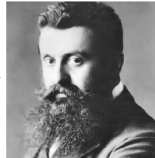
Abb. 9: Herzl

Viele Juden flohen nach England. In der Folge kam es zum Aufstieg des British Empire. Bis zum ersten Weltkrieg war England die Schutzmacht der europäischen Juden, im 19. Jahrhundert gab es sogar mit Benjamin Disraeli einmal einen jüdischen Premierminister. Im 19. Jahrhundert lebte die Bewegung des Zionismus auf, die sich auf der politischen Ebene für die Neugründung des Staates Israel im alten biblischen Kernland stark machte. Die erste jüdische Einwanderungswelle nach Israel fand um 1880 statt. Theodor Herzl organisierte 1897 den ersten Zionistischen Weltkongress. Bereits 1893 hatte er in sein Tagebuch geschrieben: „Es wird einen jüdischen Staat geben. Wenn nicht in 5 Jahren, dann in 50 Jahren.“ Es wurden 55 Jahre.