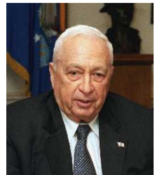
Abb. 13: Scharon

Durch das Verhalten der übrigen Araber wurde ein Flüchtlingsproblem kreiert, das gar nicht notwendig gewesen wäre, wenn man in der arabischen Welt wirklich den Frieden gesucht hätte. Der Sinn des Ganzen bestand jedoch aus der Sicht der Araber darin, ein palästinensisches Standbein in Israel zu haben, um auf der Grundlage einer dauerhaften palästinensischen Besiedelung ein Anspruchsrecht auf das Gebiet Israels in der arabischen Welt zu begründen. Die Palästinenser wurden also im Dienst der arabischen Gesamtinteressen instrumentalisiert. Israel wurde von den Arabern zum unrechtmäßigen Besatzer erklärt, der den Palästinensern ihr Land weggenommen habe. Das führte im nächsten Schritt zu der Behauptung, dass die Palästinenser das Recht besäßen, sich die Gebiete von Israel im Kampf zurück zu erobern. Auf diesem Hintergrund wurde 1964 in Kairo von Yassir Arafat und Gamal Abdel Nasser die PLO (Palestine Liberty Organization) ins Leben gerufen. Über den ersten Libanonkrieg Israels gegen die PLO haben wir bereits gesprochen (siehe auch unter: Die Palästinenser).