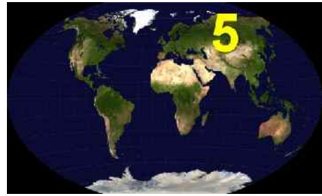
Abb. 7: Reich 5

Hesekiel 39 teilt uns in kurzen Worten das Ergebnis des Konfliktes mit. Russland wird mit all seinen Verbündeten nach Israel einmarschieren und dort im Gebiet der Westbank eine vernichtende Niederlage von der Hand Gottes erleiden. Gott hat eine Bundeszusage an Israel gegeben, die er erfüllen wird. Auch die Macht Russlands wird das nicht verhindern. Israel wird endgültig zur Weltmacht aufsteigen, Russland und seine Verbündeten werden in der Bedeutungslosigkeit versinken. Damit wird auch der letzte der drei Könige gefallen sein, nämlich der König Nummer 5. Der Untergang der russischen Armee wird die Position des falschen Messias Großisraels, des Antichristen, ungeheuer stärken, denn viele Israelis werden natürlich glauben, dass „ihr Messias“ diesen Sieg für Israel durch ein Wunder errungen hat.