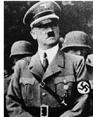
Abb. 9: Hitler

Der erste Diktator, der uneingeschränkte Kontrolle über die Bewaffnung der Nation hatte, war ebenfalls Adolf Hitler. Niemand vor ihm und niemand nach ihm hat das bisher fertig gebracht. Nur die Wehrmacht, die Polizei, die SS und die Gestapo waren bewaffnet. Die gesamte Bevölkerung war wehrlos. In Deutschland ist es bis heute so geblieben. Die Bundeswehr ist mit Ausnahme der wenigen gut ausgebildeten Zeitsoldaten, die sich überwiegend als UN-Soldaten im Ausland befinden, eine Operettenarmee aus Wehrpflichtigen ohne jegliche Kampferfahrung. Die Zivilbevölkerung ist total entwaffnet. In den USA tobt heute ebenfalls der Kampf um die Entwaffnung der Bevölkerung. Noch setzen sich viele zur Wehr, aber es wird schließlich wohl doch dazu kommen. Durch absichtlich herbeigeführte Amokläufe (Beltway-Snipers, School Shootings etc.) wird eine Atmosphäre in der Bevölkerung erzeugt, in der über kurz oder lang die Mehrheit der totalen Entwaffnung zustimmen wird.