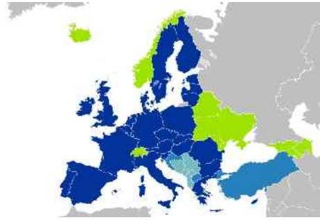
Abb. 3: Staaten der EU

Europa wird wahrscheinlich nicht direkt in die gewaltigen Kriegshandlungen des dritten Weltkrieges verwickelt sein, da es bereits zwei Weltkriege überstanden hatte. Europa ist zudem nach den Aussagen der Bibel das Zentrum der kommenden Weltmacht, es wird nicht vernichtet. Es ist ja wie gerade gesagt das Herkunftsreich des Drachen oder Antichristen. Übrigens sieht es auf der Landkarte auch genauso aus. Das hat mich als Kind schon gewundert. Schauen sie sich die Karte der EU doch einmal genauer an. Spanien bildet den