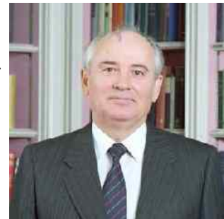
Abb. 6: Gorbatschow

Manche Ausleger der Bibel haben Gog mit dem ehemaligen russischen Präsidenten Michail Gorbatschow identifiziert. Michail Fjodorowitsch Gorbatschow wurde am 02.03.1931 in dem Dorf Privolnoye in der Region Stavropol geboren. Die Vorfahren Gorbatschows trugen vor der russischen Revolution den Namen Gogrbachev (Christian Newsletter Prophecy in the News, November 1989), der die Silbe Gog enthält. Die Region Stavropol ist identisch mit dem Gebiet, das in der Bibel als das Land Magog bezeichnet wird. Da Gorbatschow natürlich auch als ehemaliger Präsident der UDSSR bekannt ist, könnte man ihn demnach als einen König von Russland bezeichnen. Russland ist in der Bibel bekannt unter den Namen Rosch (Rus), Meschech (Moskau) und Tubal (Tobolsk). Nimmt man dies alles zusammen, dann kommt man auf die Bezeichnung: Gog vom Lande Magog, König von Rosch, Meschech und Tubal.