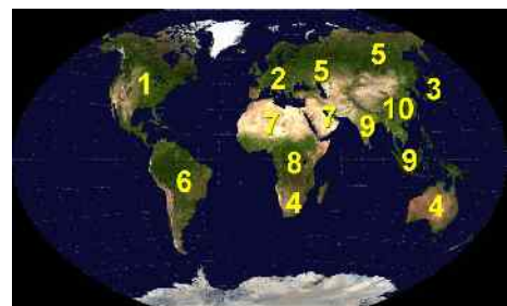
Abb. 1: Die 10 Reiche

Alles was bisher in der neuzeitlichen Weltgeschichte seit dem 16. Jahrhundert abgelaufen ist, gehörte also zu den Vorbereitungen für das antichristliche Weltreich. Die Vollendung wird kommen, wenn der geplante Weltherrscher in Person öffentlich auftreten wird. Das wird nach meiner Ansicht wie bereits gesagt am Ende des kommenden dritten Weltkrieges geschehen (siehe hierzu den Abschnitt über die Weltgeschichte). Um also unsere Frage nach dem zeitlichen Anfangspunkt des antichristlichen Weltreiches zu beantworten, kann gesagt werden: Es wird der Moment sein, in dem der Antichrist (wahrscheinlich am Ende des dritten Weltkrieges) persönlich an die Öffentlichkeit treten wird. Er wird zunächst die Herrschaft über Israel antreten, später die Herrschaft über die ganze Erde.