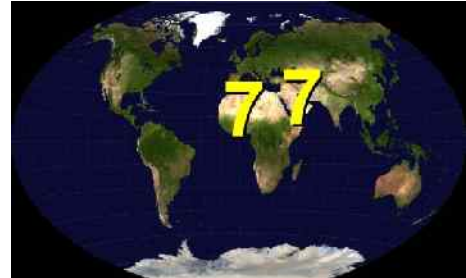
Abb. 2: Region 7

Unsere Betrachtung soll demnach unmittelbar beim Auftreten des Antichristen beginnen. Die Ereignisse, die zu seinem Auftreten führen, sind in dem Kapitel über die Weltgeschichte behandelt. Sie werden hier nur insoweit angesprochen, als es zum Verständnis des Zusammenhanges unerlässlich ist. Das Gleiche gilt für die Ereignisse in Israel. Da der Antichrist wesentliche Dinge in Israel tun wird, die mit den sonstigen Weltereignissen unmittelbar zusammen hängen, werden Sie im vorliegenden Abschnitt Textpassagen wieder finden, die im Abschnitt über Israel ebenfalls vorkommen. Dies sollte sie nicht befremden. Die Ereignisse sind so stark ineinander verwoben, dass sie nicht immer vollständig voneinander zu trennen sind. Betrachten Sie daher bitte die entsprechenden Textpassagen als eine Erleichterung für den Leser, um unnötiges Blättern zu vermeiden