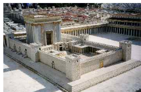
Abb. 10: Modell des Tempels

Für zwei Drittel der Israelis werden diese Bedenken am Tag der Einweihung des dritten Tempels enden. An diesem Tag wird der Antichrist nämlich völlige Religionsfreiheit für die Orthodoxen ermöglichen, und die Zweidrittelmehrheit wird ihm glauben. Er wird an