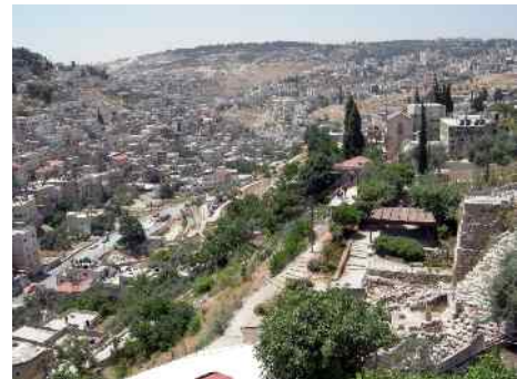
Abb. 13: Kidrontal

Jesus Christus ist der Sohn Gottes, der Erlöser und der Richter in einer Person. Er hat klar gesagt, dass er wieder kommen wird. Es wird auch geschehen, verlassen sie sich darauf. Nach seinem Sieg wird er persönlich im Tal Josaphat bei Jerusalem sitzen und alle noch lebenden Menschen aus den übrigen Nationen der Erde richterlich beurteilen. Es wird viele geben, die begnadigt werden, aber auch viele Verlorene.