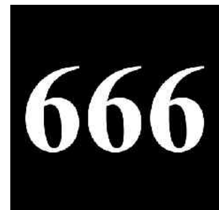
Abb. 8: Zahl des Tieres

Genauso wird es unter dem Antichristen wieder sein. Er wird zu Beginn als der wirtschaftliche Welterlöser gefeiert werden. Diese Tatsache wird es ihm leicht machen, innerhalb kurzer Zeit das Malzeichen an der Stirn und an der rechten Hand einzuführen. Nur diejenigen, die aus der Bibel (oder vielleicht auch aus dem vorliegenden Buch) wissen, dass sie es auf keinen Fall annehmen dürfen, werden es ablehnen. Diese Ablehnung wird für sie zunächst einmal zur Folge haben, dass sie vom Wirtschaftskreislauf völlig ausgeschlossen sein werden, denn sie werden weder kaufen noch verkaufen können