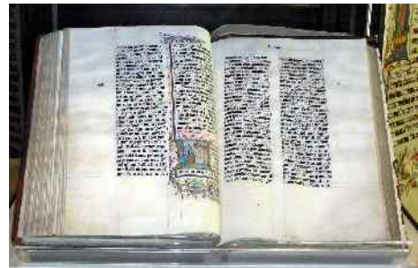
Abb. 12: Die Bibel

Er wird direkt aus dem Himmel über Paran (Nordostsinai) und Teman nach Edom kommen (Habakuk 3,3-15) und die Juden von Bozra/Petra (die Hütten Judas nach Sacharja 12,7) zuerst erretten. Er wird vor den befreiten Juden aus Bozra/Petra herausziehen als der große Durchbrecher der feindlichen Linien (Micha 2,12-13). Dann wird er das gesamte Land Edom auf ewig vernichten. Das wird für die dort noch lebenden Palästinenser den endgültigen Untergang bedeuten. In seinem weiteren Kampf wird er nach Israel hinaufziehen und auf dem Weg zahlreiche weitere Feinde töten. Unterwegs wird er aus einem Bach trinken (Psalm 110,5-7). Schließlich wird er mit blutigen Kleidern auf den Bergen Israels ankommen (Jes.63,1-7). Im Tal Josaphat am Südennde der Stadt Jerusalem wird er den Rest der antichristlichen Armeen vernichten und zuletzt als der große Sieger den Ölberg in Jerusalem besteigen. Der Ölberg wird sich spalten zu einem großen Tal, in das die letzten gläubigen Juden Jerusalems hinein fliehen werden (Sacharja 12 und 14).