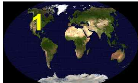
Abb. 5: Reich I

Die Zerstörung Nordamerikas wird möglicherweise so fürchterlich sein, dass nur wenige Einwohner sie unversehrt überleben werden. Auch von den 6 Millionen Juden Amerikas würden diese Katastrophe nur sehr wenige überleben. Gott wird aber genau das nicht zulassen. Er hat einen Bund mit Israel geschlossen und wird zumindest einen Großteil seines Volkes auch aus Nordamerika nach Hause bringen. Deshalb wird meines Erachtens eine Welle von Antisemitismus in Nordamerika der Zerstörung unmittelbar vorangehen. Es wird voraussichtlich so sein, dass der Antisemitismus in dem faschistischen Polizeistaat Nordamerika, der heute in der Entstehung begriffen ist, sich immer mehr steigern wird. Er wird innerhalb sehr kurzer Zeit vor und während der Wirren des dritten Weltkrieges zum vollen Durchbruch kommen. Alle Juden in Nordamerika werden vor der Wahl stehen, entweder das Land fluchtartig unter Verlust all ihrer Besitztümer zu verlassen, oder inhaftiert beziehungsweise umgebracht zu werden. Viele werden tatsächlich umkommen. Die Übrigen werden sich natürlich für die Flucht entscheiden. Aber wohin?